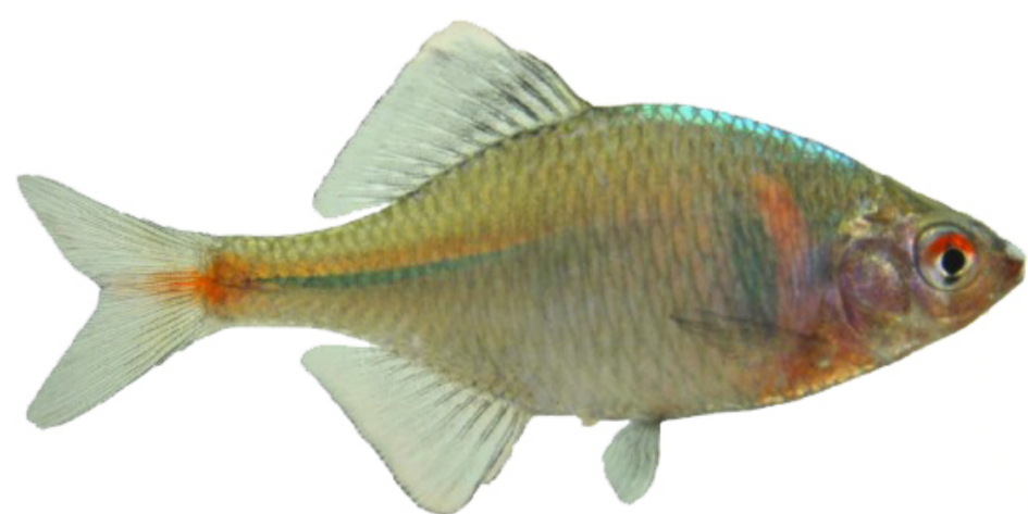
ニッポンバラタナゴ

※18時から懇親会を20時からは学生交流会「生物多様性を維持するために学生ができる事は？」が御座います。